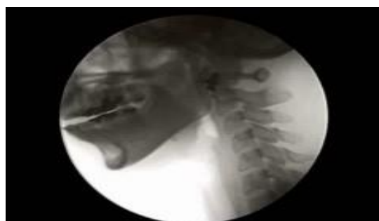
実際の嚥下造影検査の画像