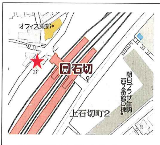
石切駅（北改札口出てすぐ）