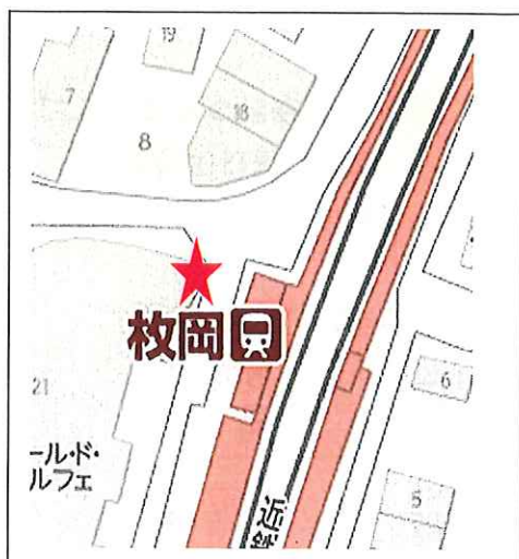
枚岡駅（西側改札口出てすぐ）