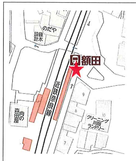
額田駅（東側改札口出てすぐ）