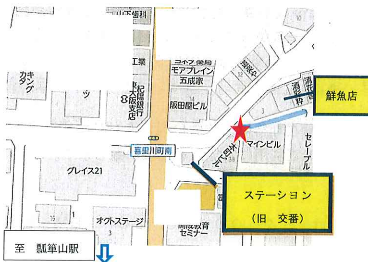
瓢箪山北（瓢箪山北商店街出口から北東方面）